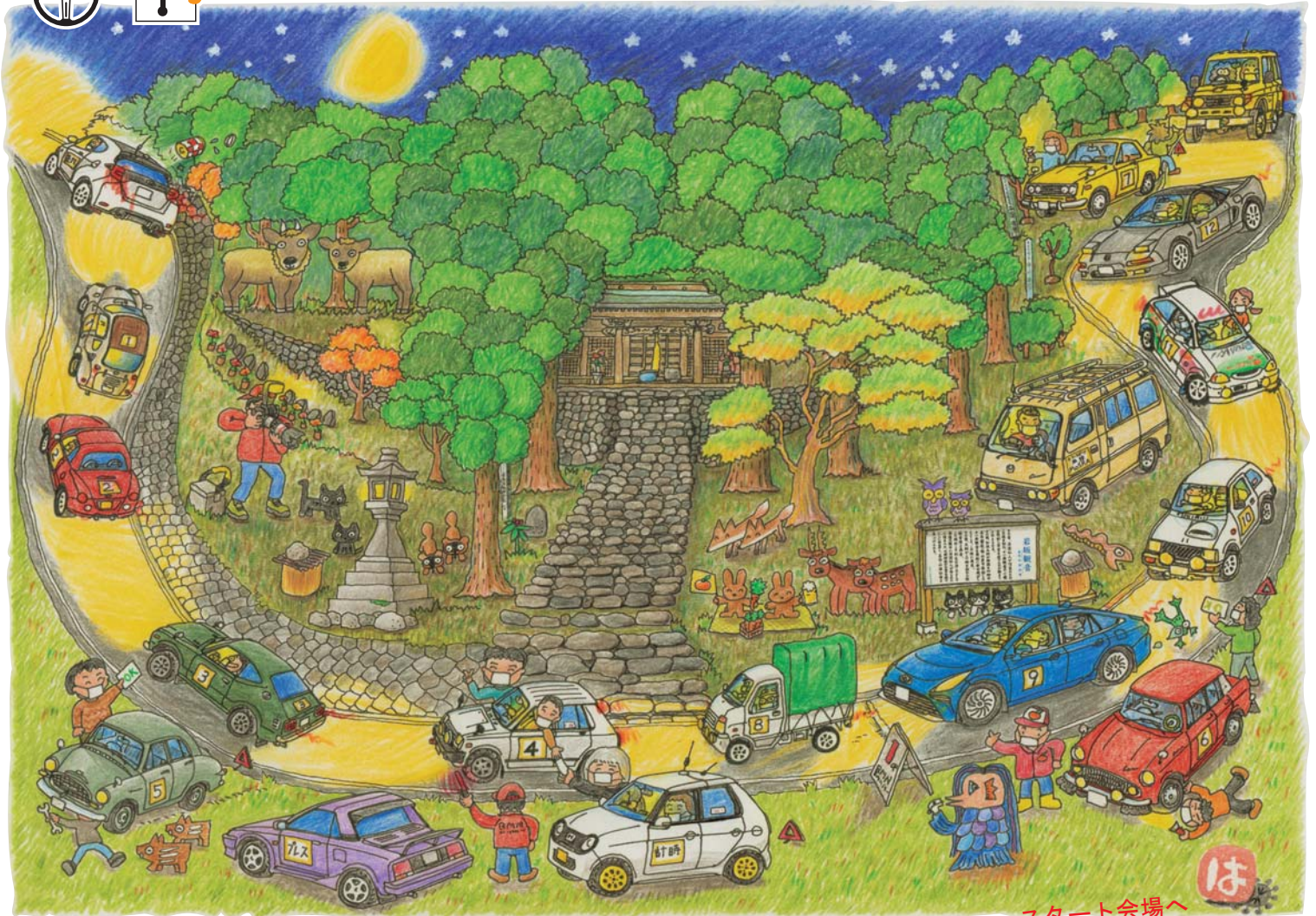
スタート・ゴールは、ふれあいの丘 道の駅しみず